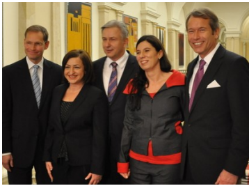
SPD-Mitglieder im neuen Senat