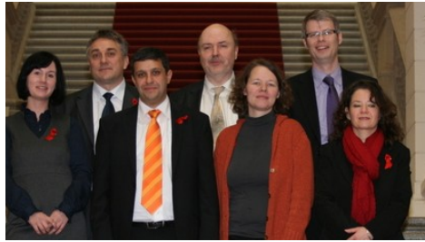
Die neue SPD-Fraktionsspitze