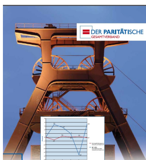
Von Verhärtungen und neuen Trends Bericht zur regionalen Armutsentwicklung in Deutschland 2011

Am 21. Dezember 2011 hat der Paritätische Gesamtverband seinen Bericht zur regionalen Armutsentwicklung in Deutschland vorgestellt.