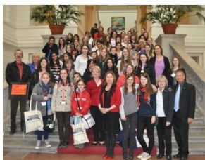
Girls' Day am 14. April 2011 in Berlin