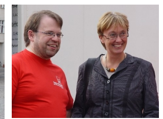
Frauen beim Wahlkampf 2011